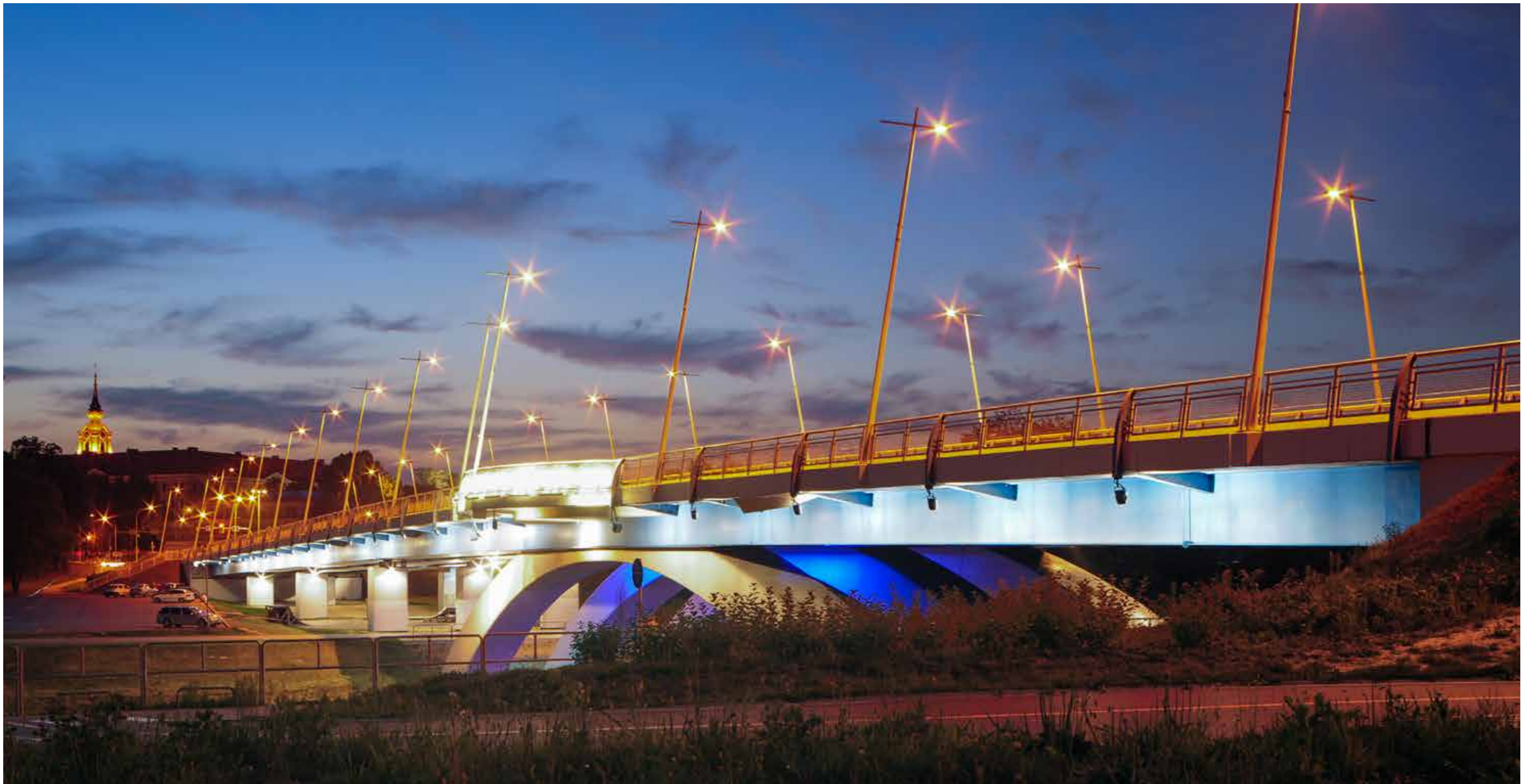
„Oświecony” (Most zamkowy w Rzeszowie). Wyróżnienie Kapituły ZMRP.